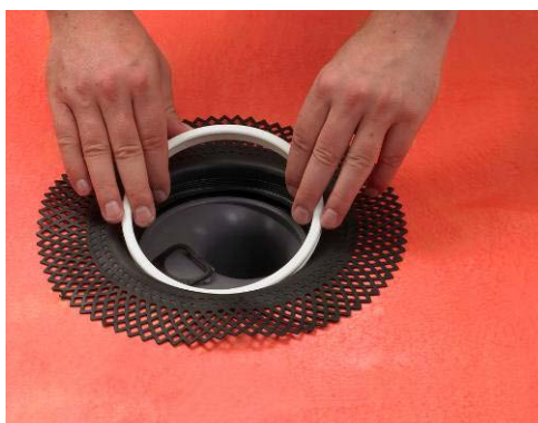
3. Montering av klämring.

För att säkra bäst vidhäftning och därmed etablera en vattentät övergång vid golvbrunn/tätskikt är det viktigt, att brunnens säte/fläns rengörs och avfettas.