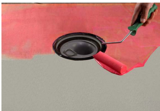
2. Primning av underlag.

Åtgång: Ca: 0,200 ltr (motsvarande ca 240 g) Primer Vattenspärr per m 2 .