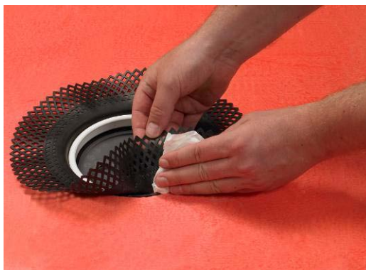
4. Rengör brunnens säte/fläns och avfetta med till exempel acetone.