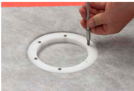
6. Montering av klämring OBS! Diagonal fastskruvning