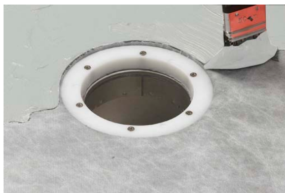
8. Påföring av Alfix Tätningsmassa.

Åtgång: 1,5 kg Alfix 1K Tätningsmassa per m 2 .