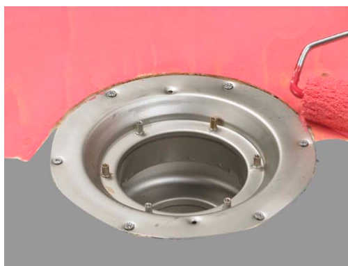
2. Primning av underlag.

Med flat, styv pensel eller med roller påføres alla ytor Alfix Primer Vattenspärr i minimum 2 appliceringar. I första appliceringen förtunnad med vatten i förhållande 1:3 och outspädd till full täckning i den efterföljande applicering. Torr tid mellan strykningarna: Ca: 1 timme vid 20°C. Åtgång: Ca: 0,200 ltr (motsvarande ca 240 g) Primer Vattenspärr per m 2 .