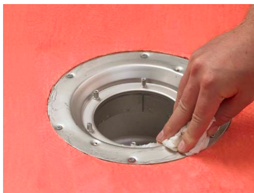
3. Rengör brunnens säte/fläns och avfett med till exempel. acetone.

För att säkra bäst vidhäftning och därmed etablera en vattentät övergång vid golvbrunn/tätskikt är det viktigt, att brunnens säte/fläns rengörs och avfettas.