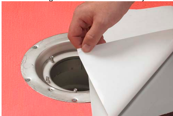
4. Montering av Alfix Tätskiktsduk.

Härefter avlägsnas andre halvan av skyddsfolien och montering avslutas.