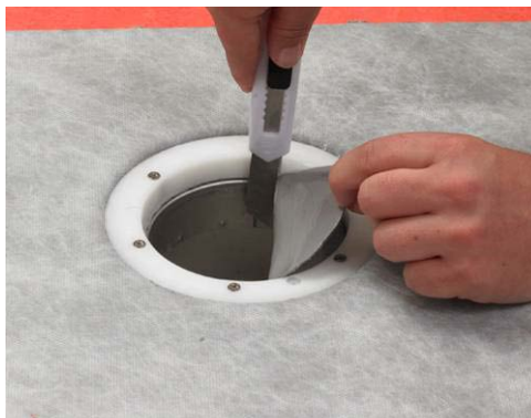
7. Skär ut hålet med kniv.