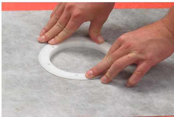
5. Markera hålet