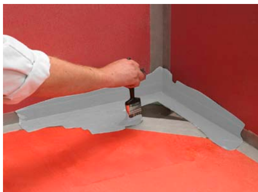
5. Påföring av Alfix Tätningsmassa.

Påför nu Alfix 1K Tätningsmassa på underlaget till ett heltäckande och porfritt skikt om ca 1 mm. Bäst resultat erhålles om massan påføres i 2 skikt, först ett tunt porfyllande skikt och därefter ett heltäckande. Arbetet utföres bäst med spackel eller med roller i 2 omgångar. Använd pensel kring golvbrunn. Torrvid: 6 – 12 timmar mellan strykningarna beroende på temperatur och ventilation. Åtgång: 1,5 kg Alfix 1K Tätningsmassa per m 2 .