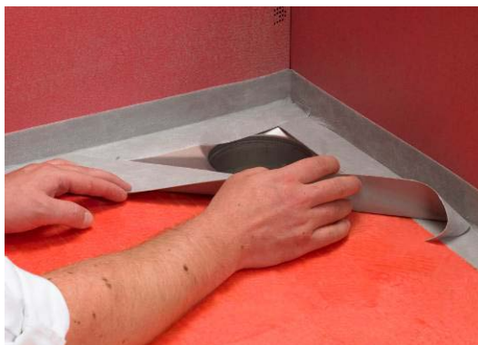
4a. Montering av Seal-Strip