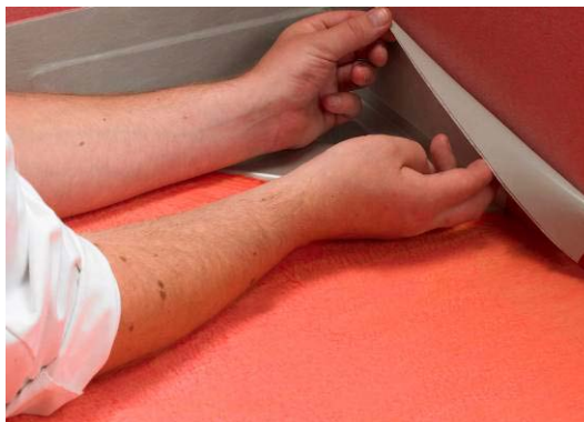
4. Montering av Seal-Strip

Alfix Seal-Strip avpassas i bitar. Montering av Seal-Strip sker lättast genom att avlägsna halva skyddsfolien och trycka fast remsan mot golvet. Härfter avlägsnas andre halvan av skyddsfolien och montering avslutas.