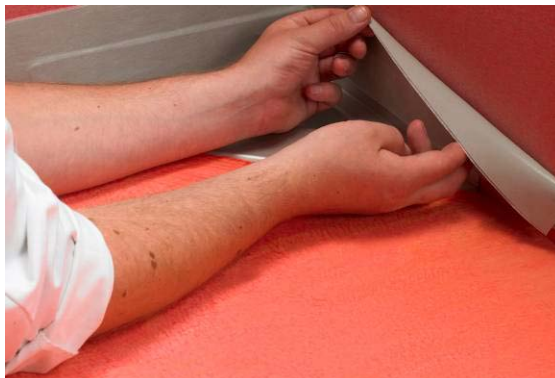
4. Montering av Seal-Strip

Alfix Seal-Strip avpassas i bitar. Montering av Seal-Strip sker lättast genom att avlägsna halva skyddsfolien och trycka fast remsan mot golvet. Härfter avlägsnas andre halvan av skyddsfolien och montering avslutas.