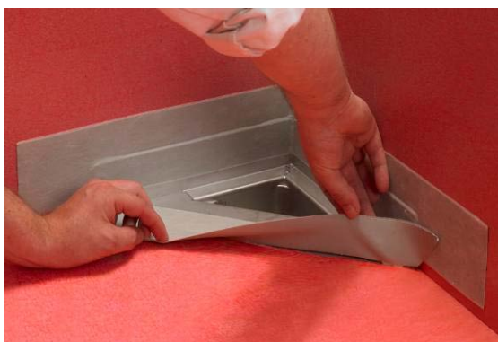
4a. Montering av Seal-Strip