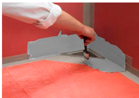
5. Påföring av Alfix Tätningsmassa.

Åtgång: 1,5 kg Alfix 1K Tätningsmassa per m 2 .