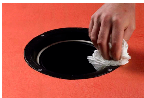
4. Rengör brunnens säte/fläns och avfetta med till exempel aceton.