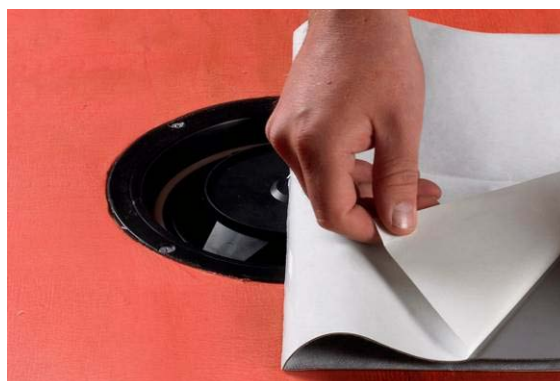
6. Montering av Alfix Tätskiktsduk.