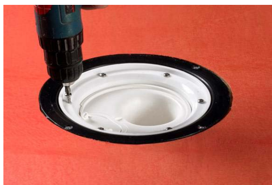
3. Tag bort klämringen.

För att säkra bäst vidhäftning och därmed etablera en vattentät övergång vid golvbrunn/tättskikt är det viktigt, att brunnens säte/fläns rengörs och avfettas.