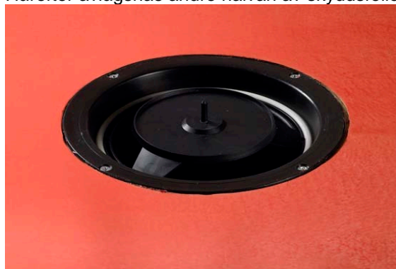
5. Placera Joti-knivens fot i brunnen.

Härefter avlägsnas andre halvan av skyddsfolien och montering avslutas.