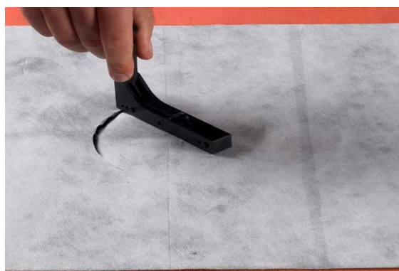
7. Skär ut hålet med kniv.