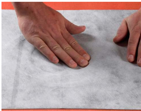
5. Markera hålet.