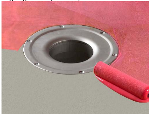
2. Primning av underlag.

Åtgång: Ca: 0,200 ltr (motsvarande ca 240 g) Primer Vattenspärr per m 2 .