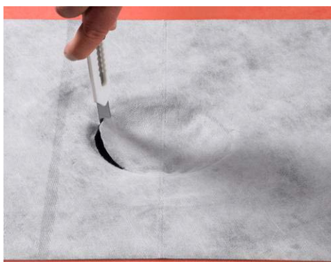
6. Skär ut hålet.