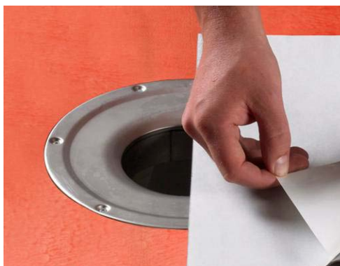
4. Montering av Alfix Tätskiktsduk.

Härefter avlägsnas andre halvan av skyddsfolien och montering avslutas.