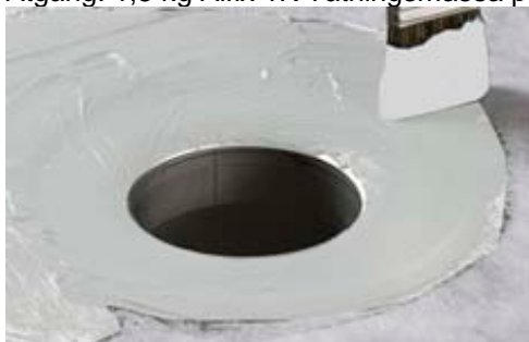
7. Påföring av Alfix Tätningsmassa.

Åtgång: 1,5 kg Alfix 1K Tätningsmassa per m 2 .