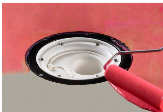
2. Primning af underlag.

Beton primes kun en gang med Alfix Primer fortyndet med vand 1:3.