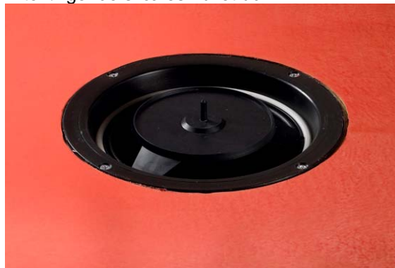
5. Montering af fod for Joti kniv.

Alfix Afløbsmanchet lægges først løst over afløbsskålen. For at fastgøre manchetten fjernes beskyttelsespapiret fra bagsiden. For at opnå det bedste resultat, bør man kun fjerne papiret fra halvdelen af manchetten og trykke den fast, før resten af papiret fjernes og montering kan færdiggøres. Efterfølgende skæres hullet ud.