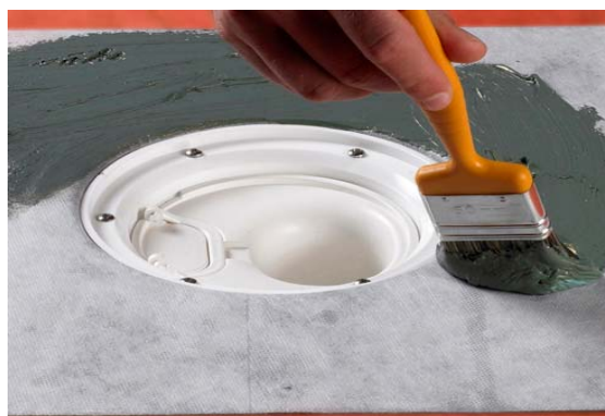
9. Påføring af Alfix Tætningsmasse.

Bemærk: Alternativt kan der i overgang mellem gulv og afløb/sluk monteres Alfix Armeringsvæv i tætningsmassen.