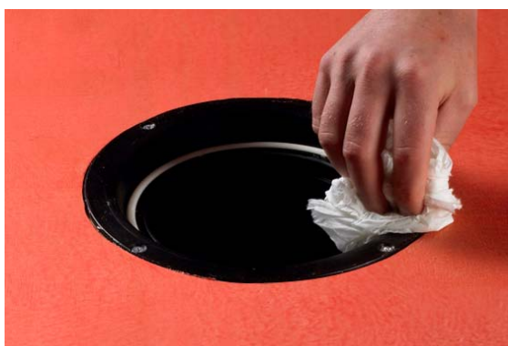
4. Rengør afløbets krave og affedt med f.eks. acetone.