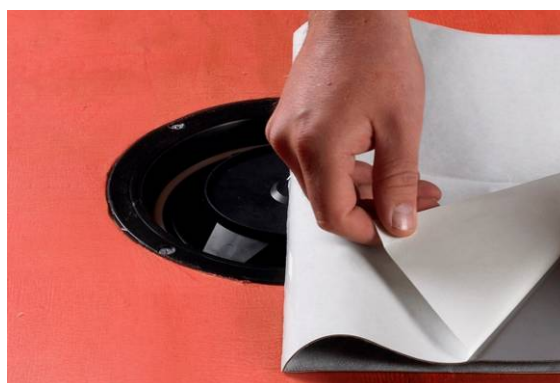
6. Montering af Alfix Afløbsmanchet.