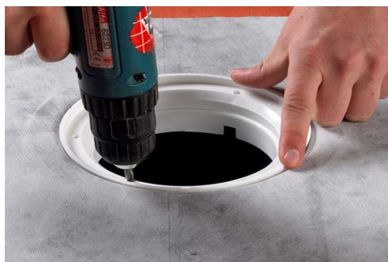
8. Montering af klemring.