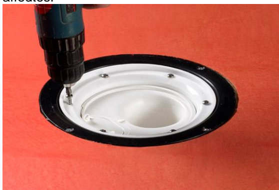
3. Fjern klemringen.

For at sikre en god vedhæftning og dermed etablere en vandtæt samling ved gulvafløbet/sluken er det vigtigt at afløbets/slukens krave rengøres og affedtes.