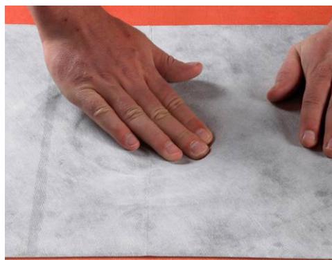
5. Markering af hullet.