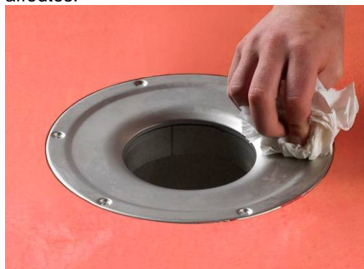
3. Rengør afløbets krave og affedt med f.eks. acetone.

For at sikre en god vedhæftning og dermed etablere en vandtæt samling ved gulv afløbet/sluker er det vigtigt at afløbets/slukers krave rengøres og affedtes.