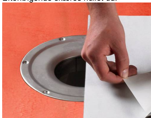
4. Montering af Alfix Afløbsmanchet.

Alfix Afløbsmanchet lægges først løst over afløbsskålen. For at fastgøre manchetten fjernes beskyttelsespapiret fra bagsiden. For at opnå det bedste resultat, bør man kun fjerne papiret fra halvdelen af manchetten og trykke den fast, før resten af papiret fjernes og montering kan færdiggøres. Efterfølgende skæres hullet ud.