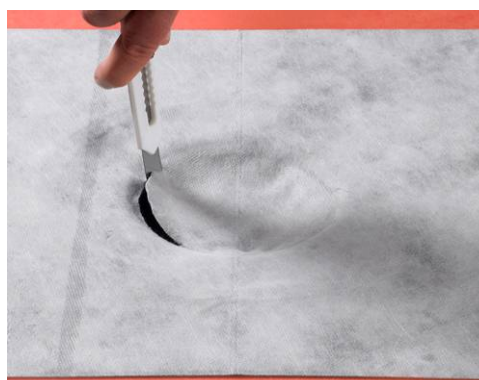
6. Skær hullet ud.