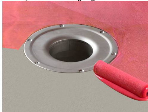
2. Primning af underlag.

Beton primes kun en gang med Alfix Primer fortyndet med vand 1:3.