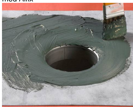
7. Påføring af Alfix Tætningsmasse.

Hele gulvfladen samt afløbsmanchet påføres tætningsmasse, som beskrevet i "Monteringsinfo 2.301, Vådtrum" og i brochuren "Vådtrum – vandtætning med Alfix"